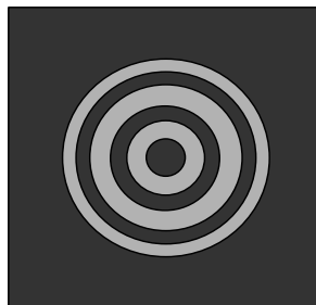
Figura 3. Patrón de un estrella en un telescopio colimado.