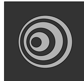
Figura 4. Patrón de un estrella en un telescopio sin colimar.