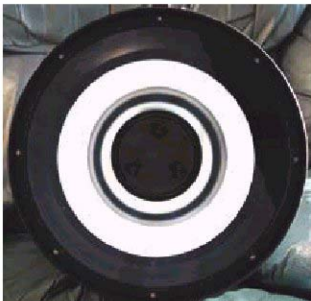
Figura 1: Aspetto degli specchi collimati