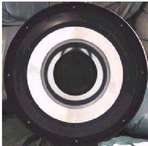
Figura 2: Aspetto degli specchi NON collimati